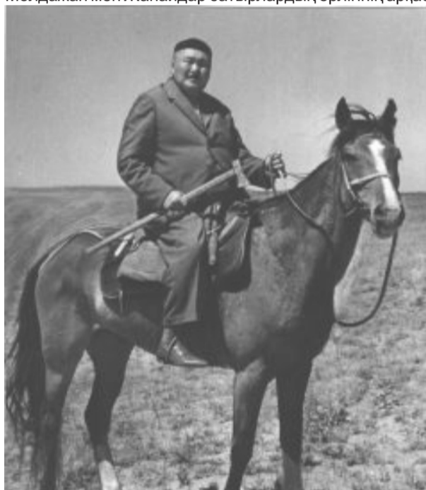
Суретте: Сәбит Мұқанов